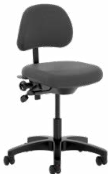
Tabouret de Technicien healthHcentric MD