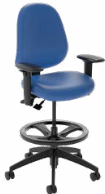
Tabouret de laboratoire FR healthHcentric