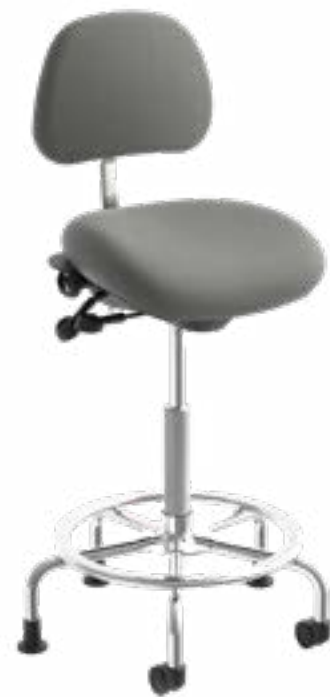
Tabouret assis-debout healthHcentric