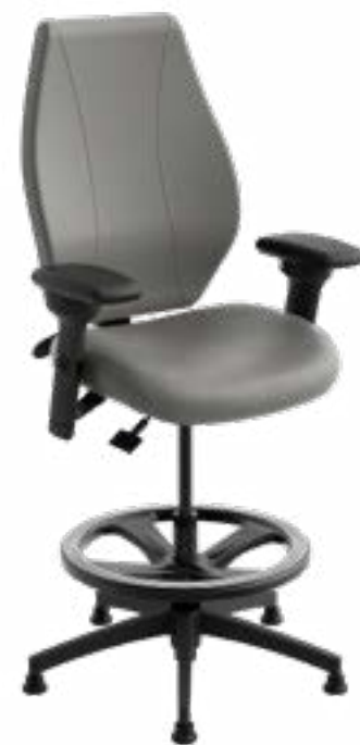
Tabouret de laboratoire H2S airCentric MD