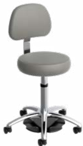
Ultime Tabouret Médical