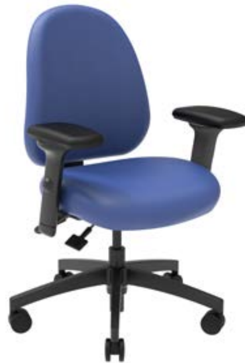
Fauteuil Poste de Garde nurseCentric

Les employés satisfaits sont plus susceptibles de rester loyaux, ce qui tend à réduire le taux de roulement. En outre, lorsque les infirmières sont à l'aise et ne souffrent pas d'inconfort, il est plus facile pour elles de se concentrer et d'accomplir leurs tâches avec efficacité. Ce sont les infirmières qui en profitent au premier chef, mais également les patients qui recevront de celles-ci des soins de meilleure qualité. Voilà qui témoigne de l'importance de faire du confort et de la sécurité des infirmières des priorités.