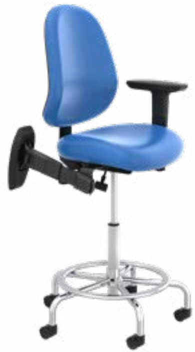
Tabouret de laboratoire C24 healthHcentric MD