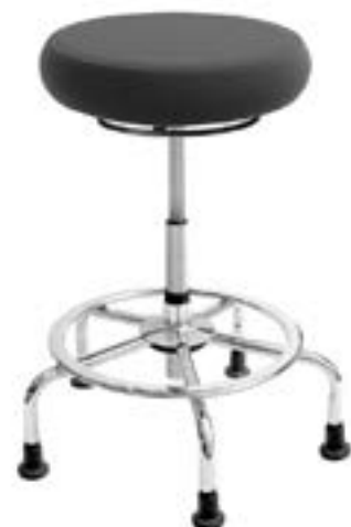
Tabouret C22 healthHcentric