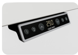
Positions de Mémoire Pré réglables